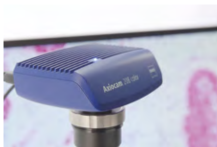
4K出力対応デジタルカメラ