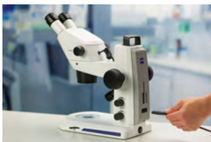
余分なアクセサリボックスやケーブルは一切不要