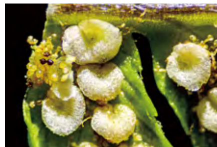
シダの胞子 ダブルアームLED