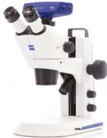
Stemi 305+Axiacam 208 color

明るさと深い焦点深度で評価の高い実体顕微鏡Stemi 305を特別価格にて提供いたします。