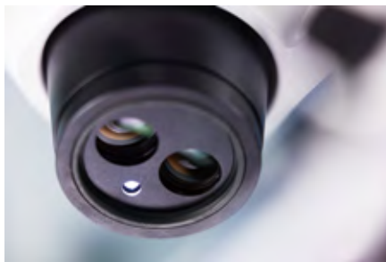
本体内蔵同軸（ニアパーチカル）照明