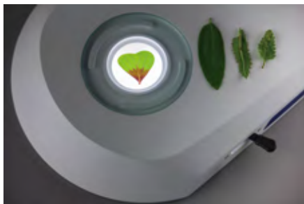
明視野と暗視野の切替えが可能な透過光ユニット