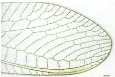
昆虫のミドリクサカゲロウ 透過明視野