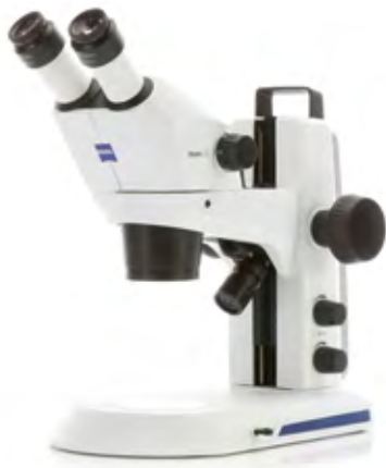
Stemi 305 (双眼) EDU