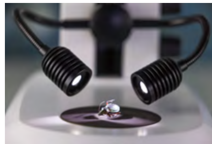
サンプル作製に最適なダブルアームLED照明